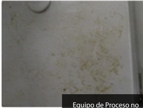
Equipo de Proceso no limpiado antes de cubrir.

© Copyright 2009 Front Line Chemicals, LLC.